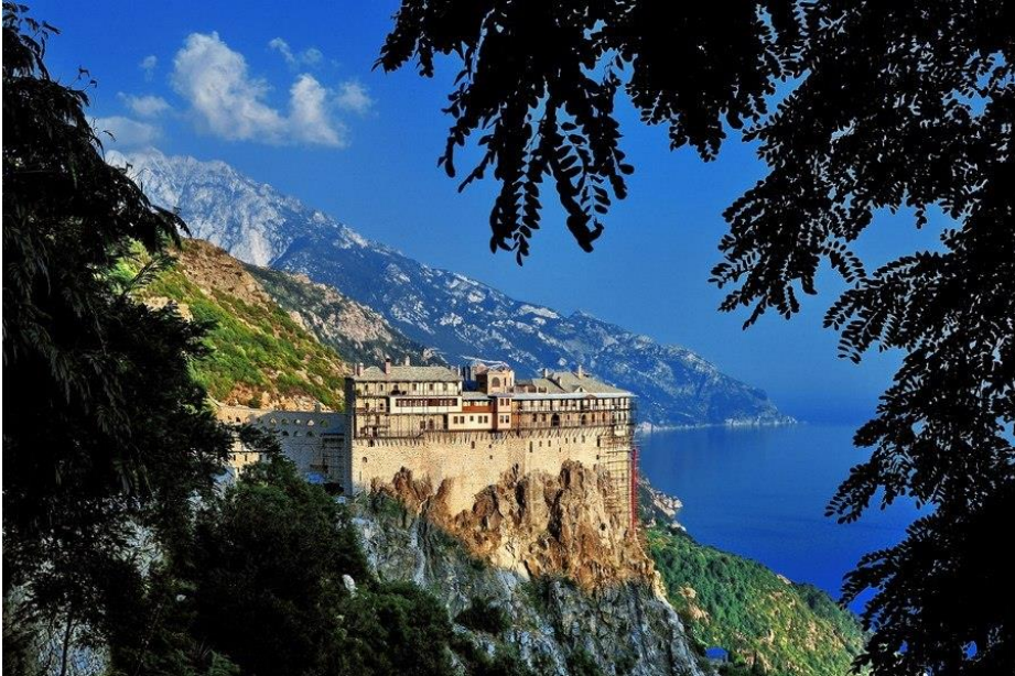
Гора Афон. Греция