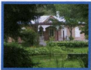
Усадебный дом А.П.Чехова в Мелихово

жителей, о тюремных начальниках и чиновничьем произволе. Чехов посещал тюрьмы, подробно изучал их техническое и санитарное состояние, встречался и беседовал со множеством людей. После возвращения с Сахалина Чехов систематизировал свои записи и написал книгу «Остров Сахалин».