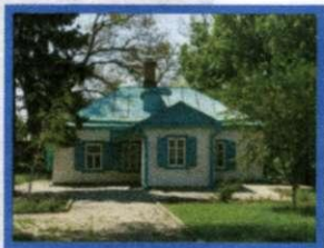
Таганрог. Дом, где родился А.П.Чехов

Сначала Чехов учился в греческой школе в Таганроге. Содержащий школу грек заставлял зазубривать уроки, бил учеников линейкой, ставил в угол на колени на крупную соль. В 8 лет, после двух лет учёбы, Чехов поступает в таганрогскую гимназию (ныне Гимназия № 2 им. А. П. Чехова). Мужская классическая гимназия была старейшим учебным заведением на юге России (основана в 1806 г.) и давала солидное по тем временам образование и воспитание.