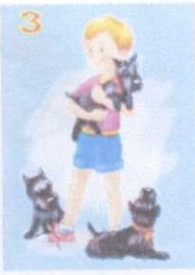
"Не хуже вас, цирковых"