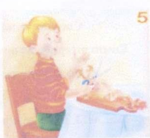
"Тайное становится явным"